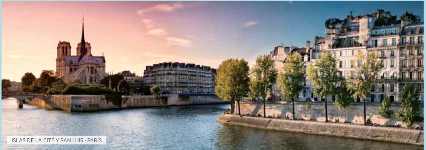
ISLAS DE LA CITÉ Y SAN LUIS · PARÍS