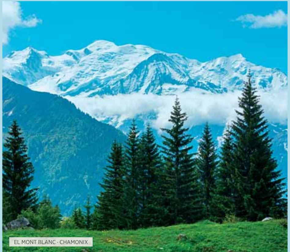
EL MONT BLANC · CHAMONIX

Desayuno. Salida hacia Pisa, la cuna de Galileo, en donde tendremos tiempo libre para contemplar la maravillosa Plaza de los Milagros, con su Catedral, el Baptisterio y la mundialmente famosa Torre Inclinada. Continuación a