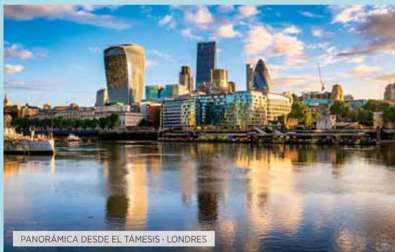
PANORÁMICA DESDE EL TÁMESIS · LONDRES