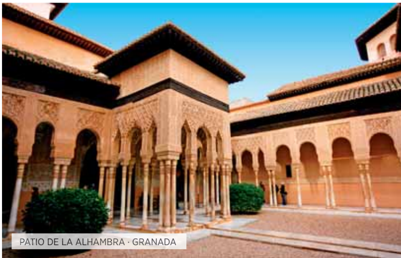
PATIO DE LA ALHAMBRA · GRANADA