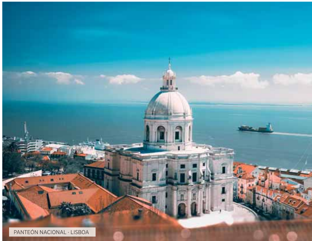
PANTEÓN NACIONAL · LISBOA

Desayuno. Por la mañana realizaremos la visita panorámica de la capital del Reino de España, ciudad llena de contrastes, en la que con nuestro guía local conoceremos las Plazas de la Cibeles, de España y de Neptuno, la Gran Vía, Calle Mayor, exterior de la Plaza de toros de las Ventas, calle Alcalá, Paseo del Prado, Paseo de la Castellana. Tarde libre o si lo desea podrá realizar una excursión op-