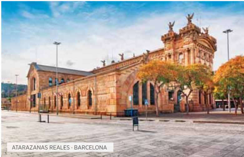
ATARAZANAS REALES · BARCELONA