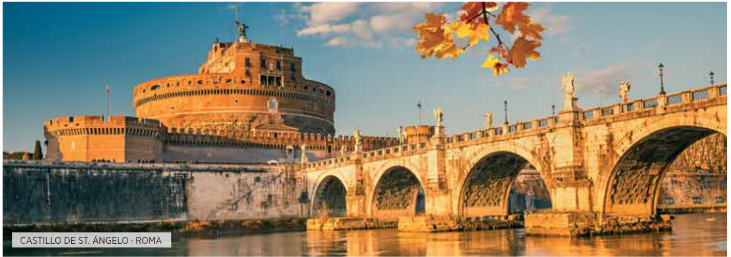
CASTILLO DE ST. ÁNGELO · ROMA