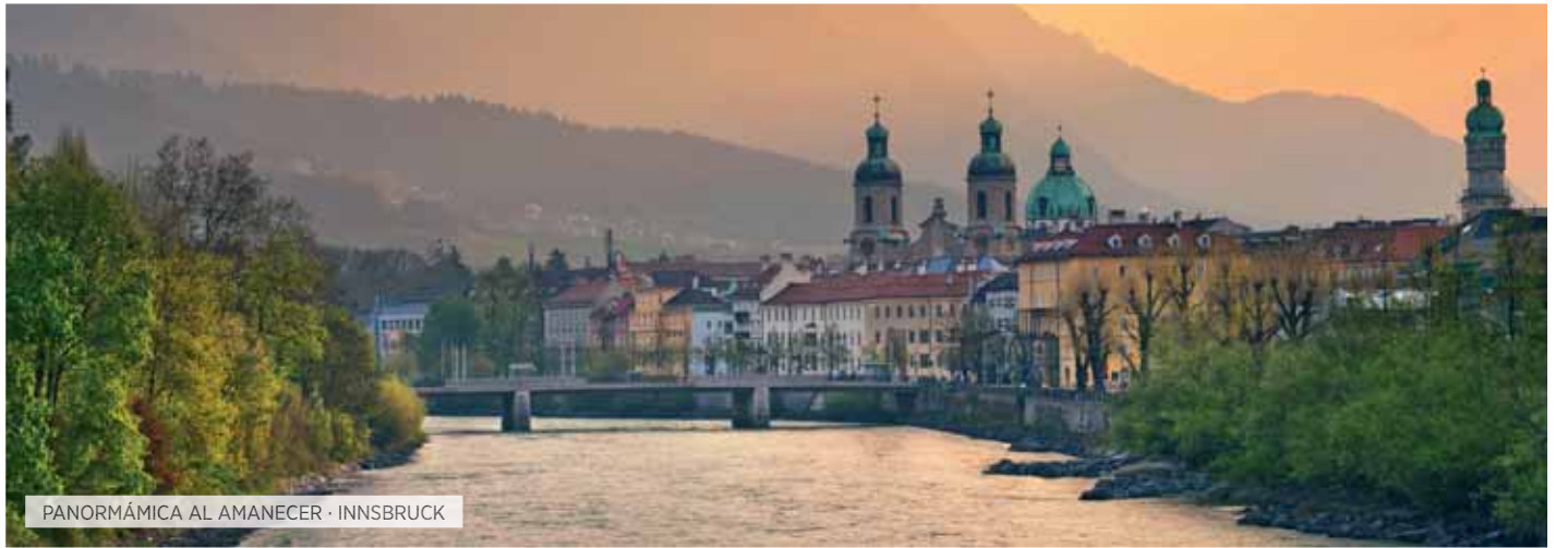
PANORMÁMICA AL AMANECER · INNSBRUCK