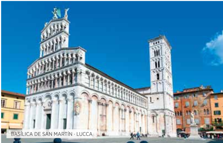
BASÍLICA DE SAN MARTÍN · LUCCA