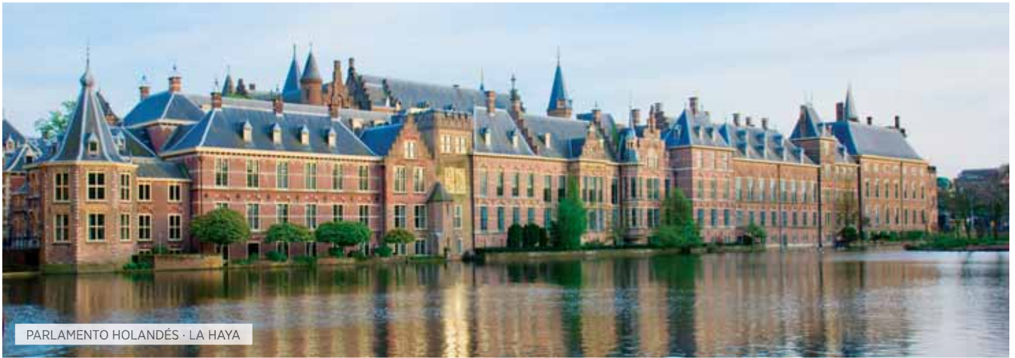
PARLAMENTO HOLANDÉS · LA HAYA