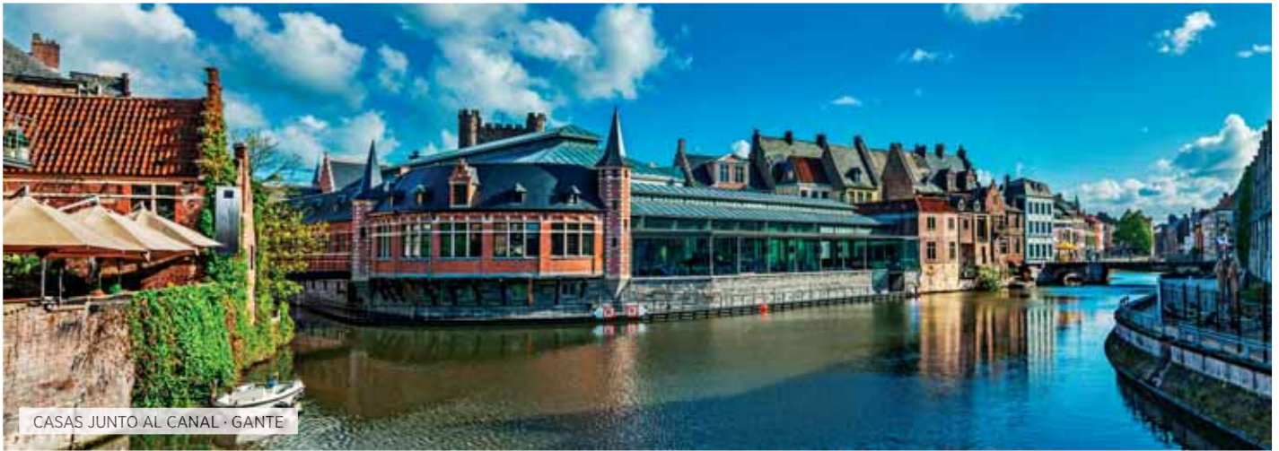
CASAS JUNTO AL CANAL · GANTE