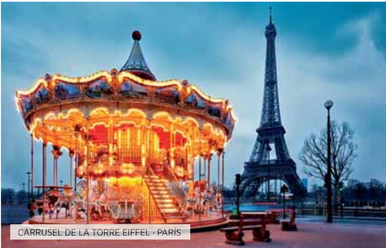
CARRUSEL DE LA TORRE EIFFEL · PARÍS