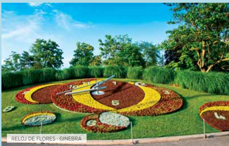
RELOJ DE FLORES · GINEBRA