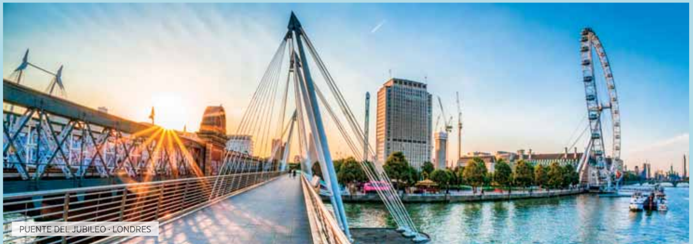
PUENTE DEL JUBILEO · LONDRES