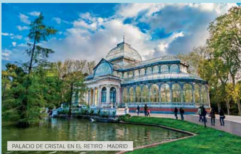
PALACIO DE CRISTAL EN EL RETIRO · MADRID