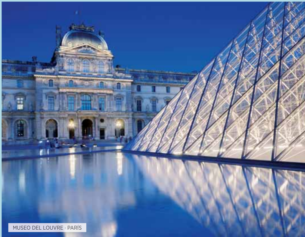
MUSEO DEL LOUVRE · PARÍS

Desayuno. Salida hacia el Valle de Loira, tierra de acogida de Leonardo de Vinci y donde se encuentran los más famosos castillos renacentistas franceses. Tiempo libre para visitar el de Chambord, mandado construir a mediados del siglo XVI por Francisco I para ser utilizado como pabellón de caza y que se alza en el corazón de una zona forestal rodeada por 31 kms de muralla. Llegada a París.