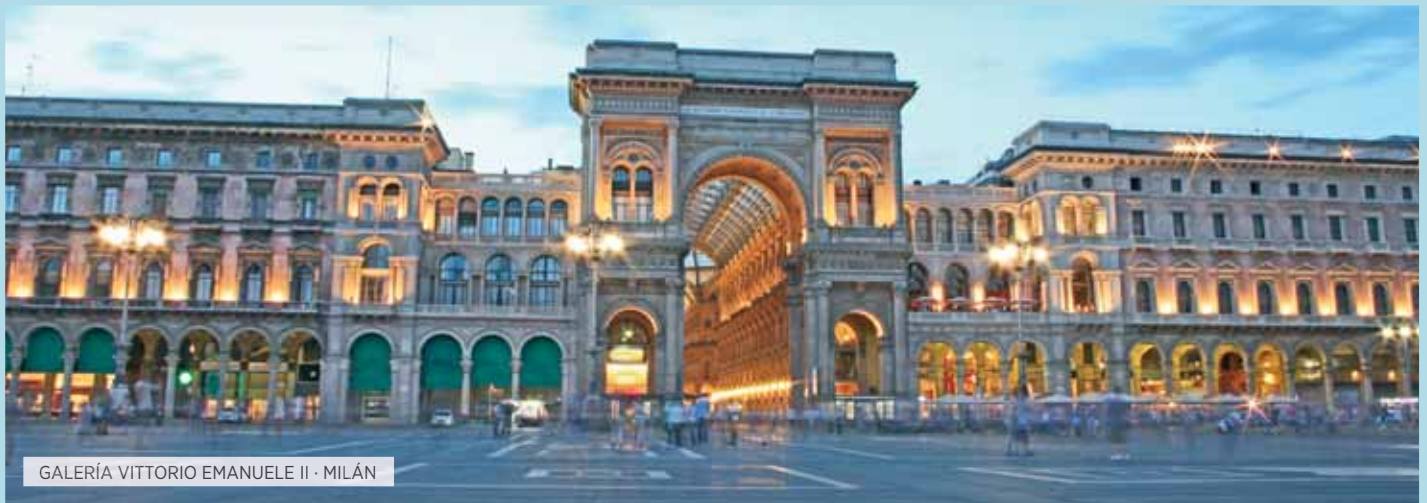
GALERÍA VITTORIO EMANUELE II · MILÁN