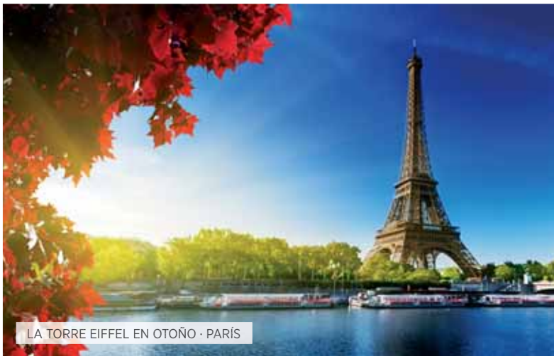
LA TORRE EIFFEL EN OTOÑO · PARÍS