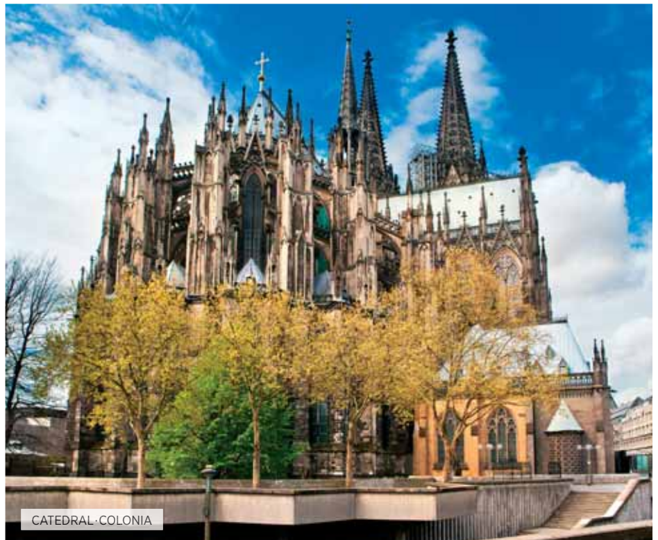
CATEDRAL · COLONIA

Desayuno. Día libre para visitar alguno de sus muchos museos, conocer alguno de los parques de la ciudad, recorrer