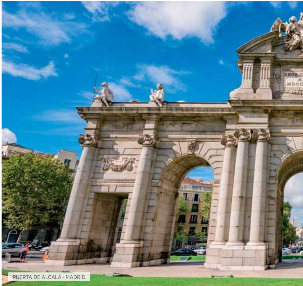
PUERTA DE ALCALÁ · MADRID

Desayuno. A la hora indicada traslado al aeropuerto para tomar el vuelo hacia París. Llegada, traslado al hotel y tiempo libre para un primer contacto con la elegante capital francesa. Por la noche tour opcional de París Iluminado. Alojamiento.