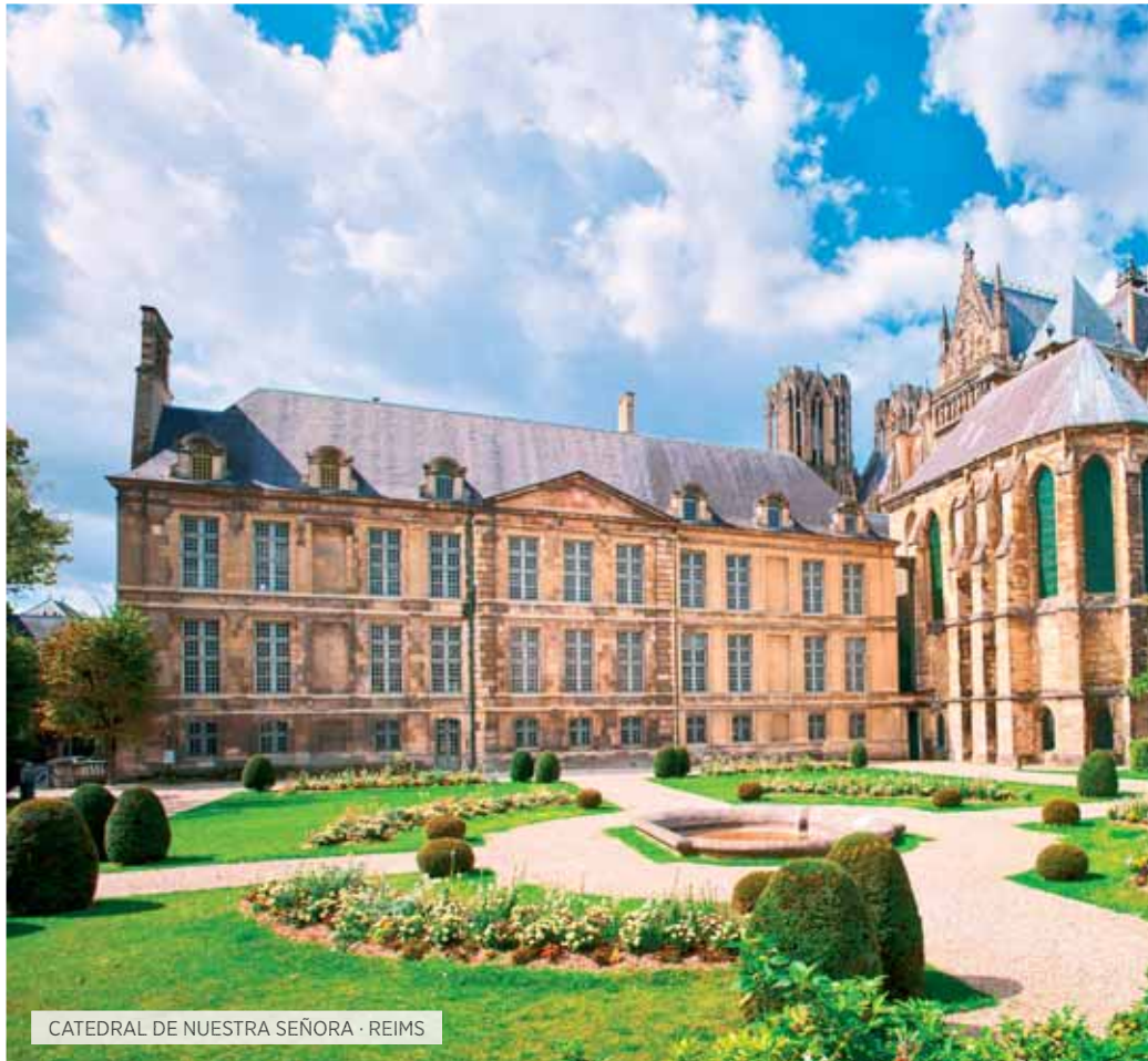
CATEDRAL DE NUESTRA SEÑORA · REIMS

Desayuno. Salida hacia Folkestone para, en el "Shuttle",* realizar en 35 minutos la travesía bajo el Canal de la Mancha y dirigimos hacia Brujas, donde tendremos tiempo libre para disfrutar del encanto de sus casas y canales. Continuación a Bruselas. Tiempo libre. Aproveche para dar un paseo por la ciudad, disfrutando de su animado ambiente nocturno y admirando la magia de la Grand Place en la noche. Cena y alojamiento.