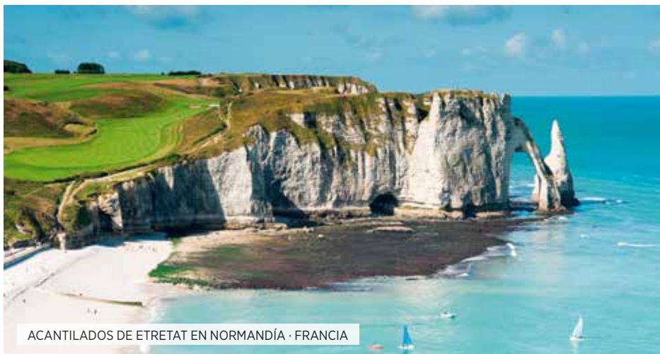
ACANTILADOS DE ETRÉTAT EN NORMANDÍA · FRANCIA