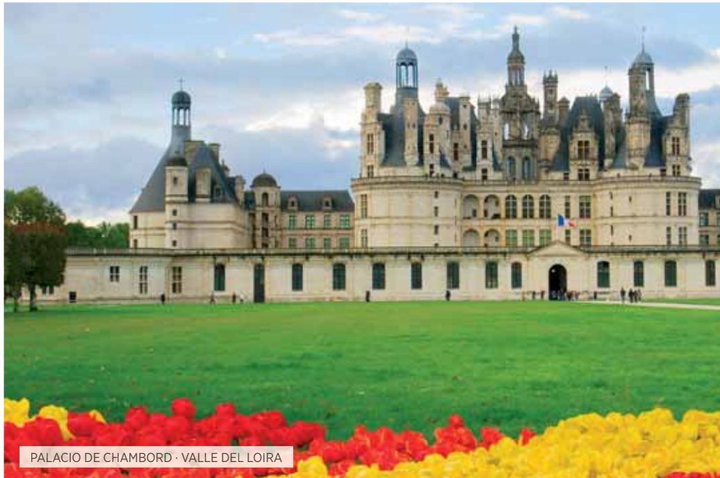
PALACIO DE CHAMBORD · VALLE DEL LOIRA

Llegada a Madrid y traslado al hotel. Resto del día libre para descubrir alguno de los muchos rincones que esconden esta bellísima ciudad, o disfrutar del ambiente madrileño saboreando un relajante café con leche en cualquier terraza de la Plaza Mayor. Cena y alojamiento.