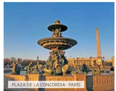
PLAZA DE LA CONCORDIA · PARÍS