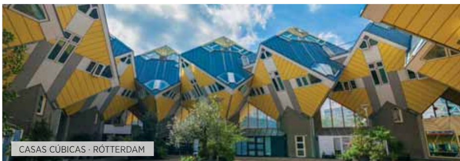
CASAS CÚBICAS · RÓTTERDAM