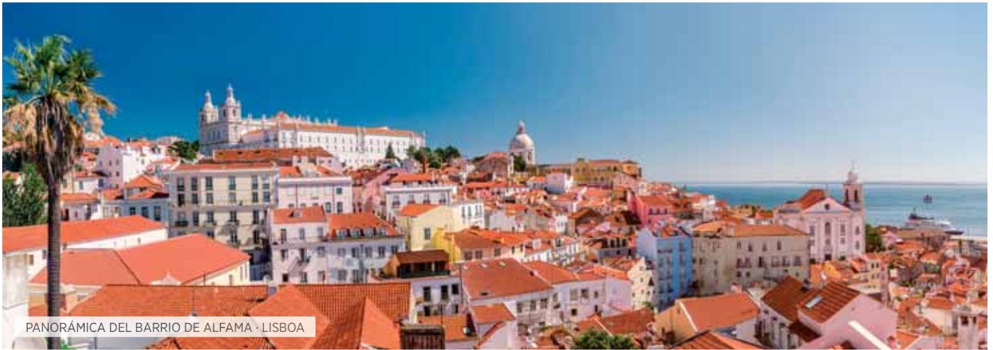
PANORÁMICA DEL BARRIO DE ALFAMA · LISBOA