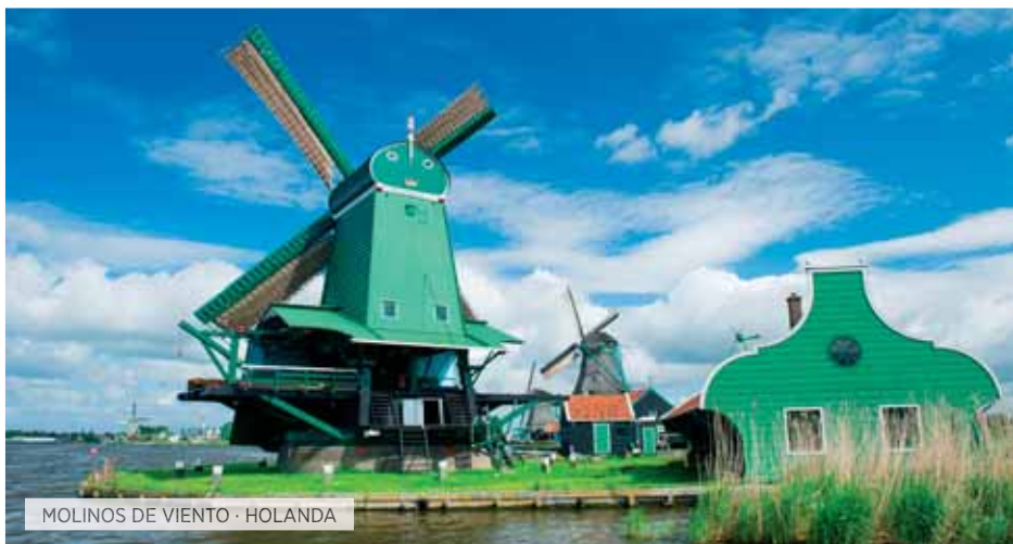
MOLINOS DE VIENTO · HOLANDA