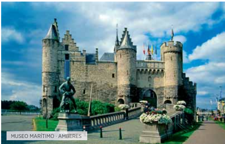
MUSEO MARÍTIMO · AMBERES