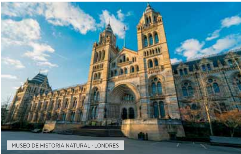
MUSEO DE HISTORIA NATURAL · LONDRES