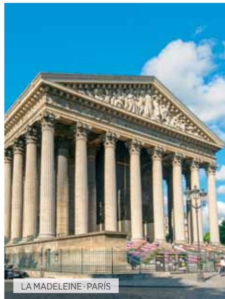
LA MADELEINE · PARÍS