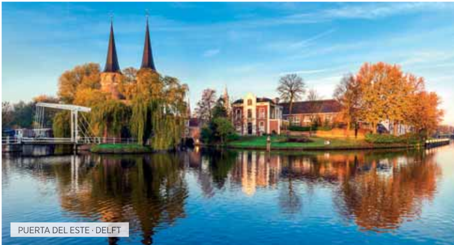
PUERTA DEL ESTE · DELFT