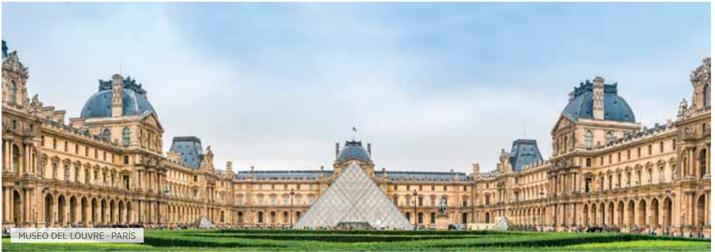
MUSEO DEL LOUVRE · PARÍS