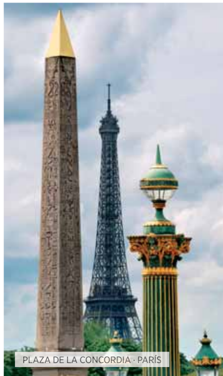
PLAZA DE LA CONCORDIA · PARÍS

Desayuno. Visita panorámica de la capital francesa: veremos las Plazas de la Concordia y de la Opera, los