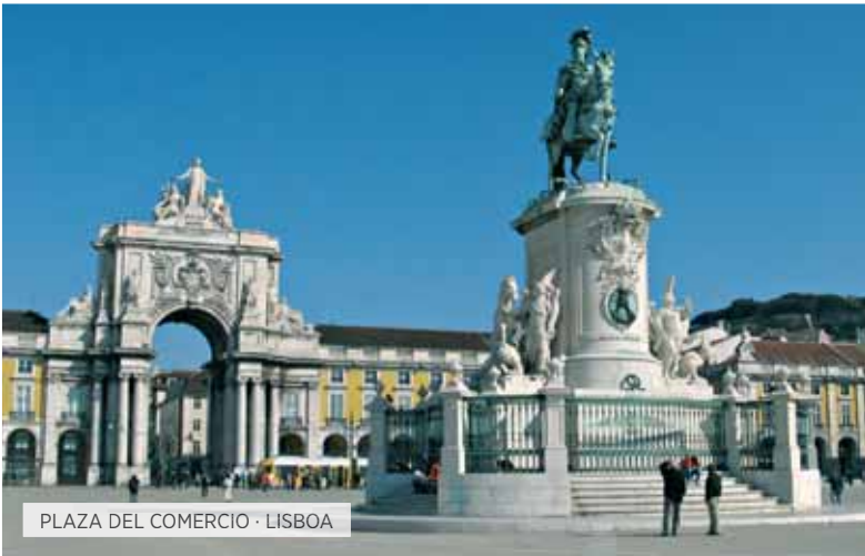
PLAZA DEL COMERCIO · LISBOA