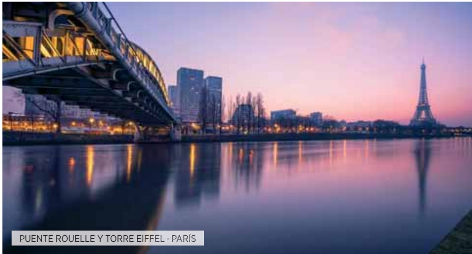
PUENTE ROUELLE Y TORRE EIFFEL · PARÍS