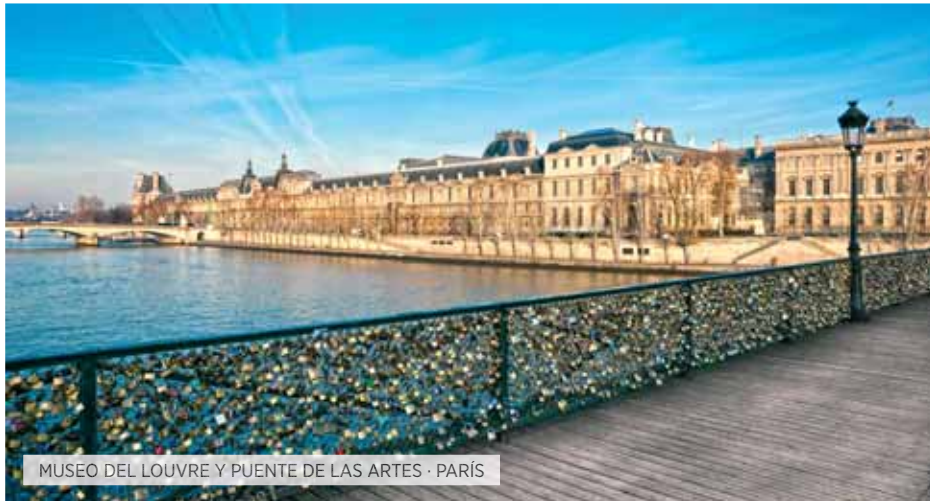
MUSEO DEL LOUVRE Y PUENTE DE LAS ARTES · PARÍS