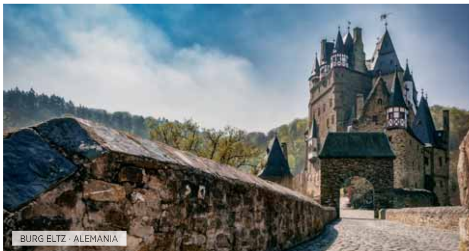
BURG ELTZ · ALEMANIA