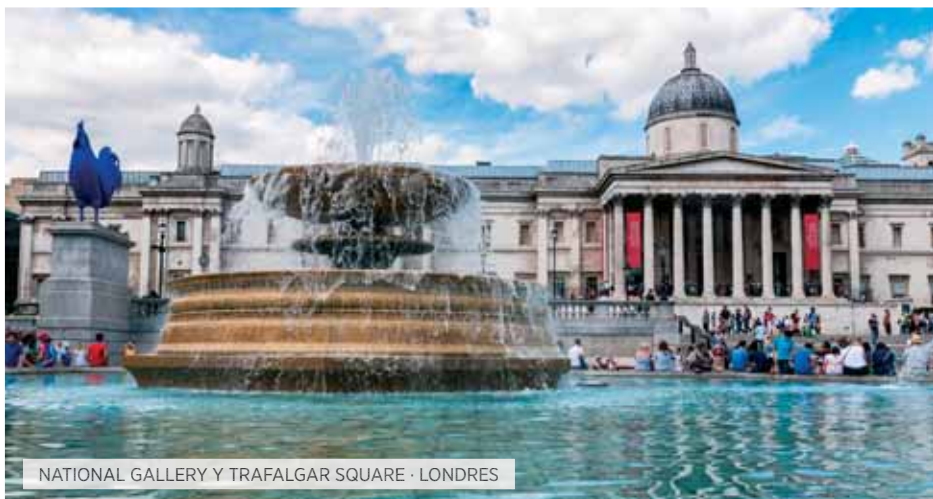
NATIONAL GALLERY Y TRAFALGAR SQUARE · LONDRES