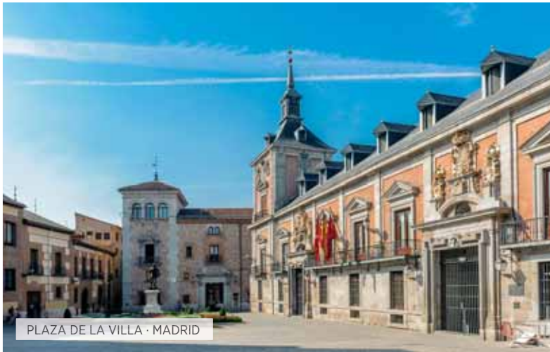
PLAZA DE LA VILLA · MADRID