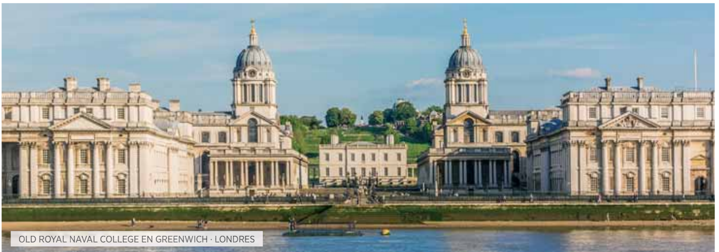
OLD ROYAL NAVAL COLLEGE EN GREENWICH · LONDRES