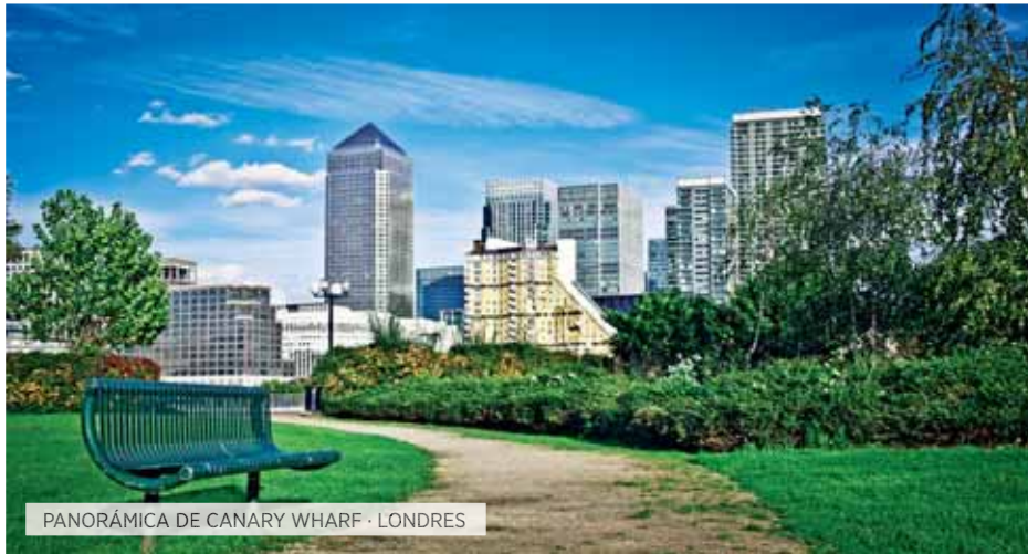
PANORÁMICA DE CANARY WHARF · LONDRES