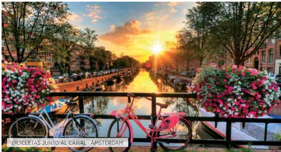
BICICLETAS JUNTO AL CANAL - ÁMSTERDAM