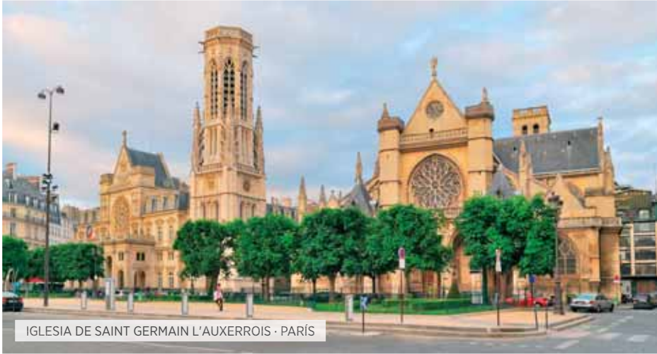
IGLESIA DE SAINT GERMAIN L'AUXERROIS · PARÍS