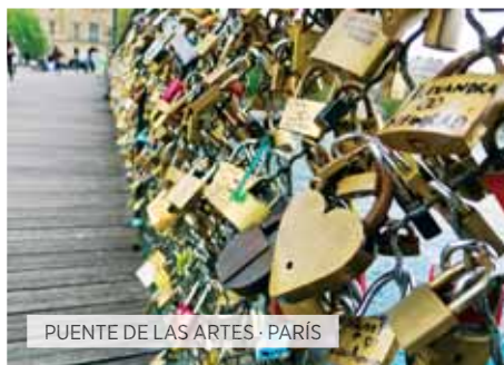
PUENTE DE LAS ARTES · PARÍS

Desayuno. Visita panorámica de los edificios y monumentos más importantes: la Plaza Dam, el Palacio Real, la Iglesia de San Nicolás, el barrio judío, etc. También visitaremos una fábrica de tallado de diamantes. Resto del día libre o