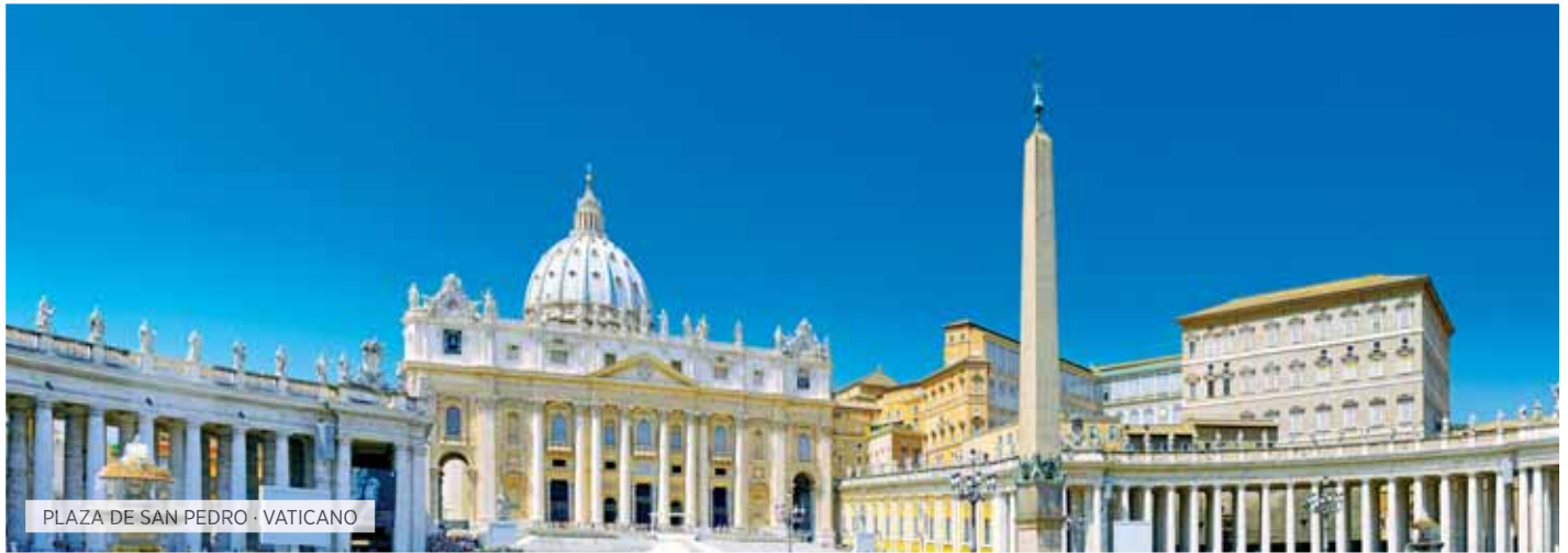
PLAZA DE SAN PEDRO · VATICANO