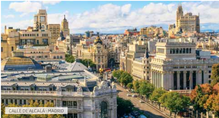
CALLE DE ALCALÁ · MADRID