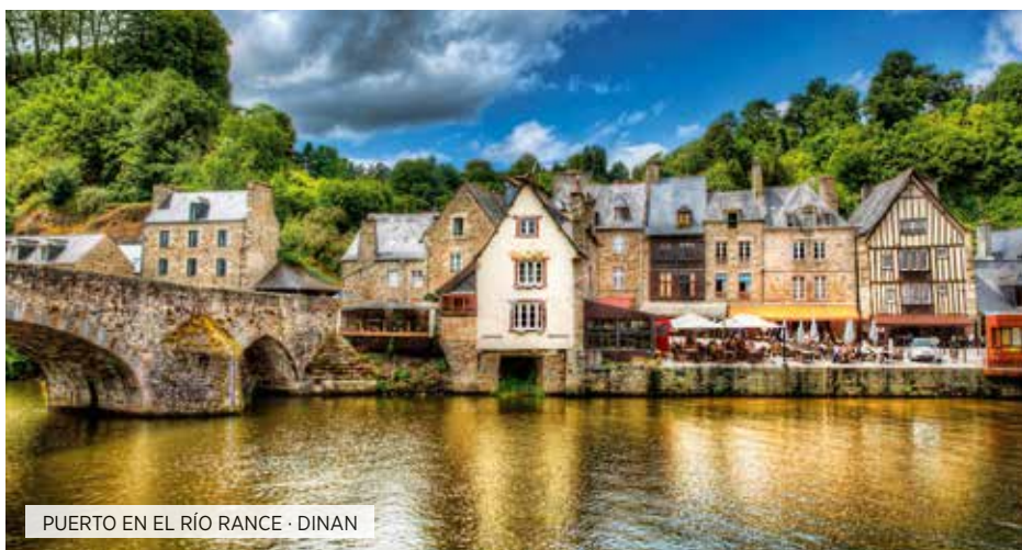
PUERTO EN EL RÍO RANCE · DINAN