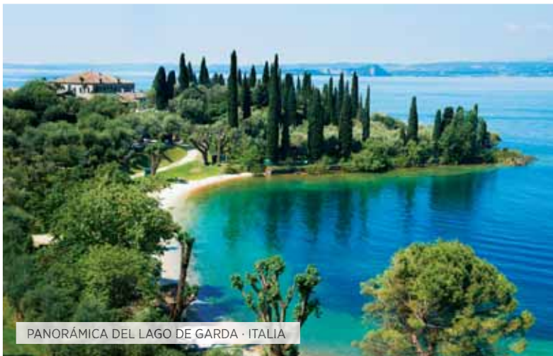
PANORÁMICA DEL LAGO DE GARDA · ITALIA