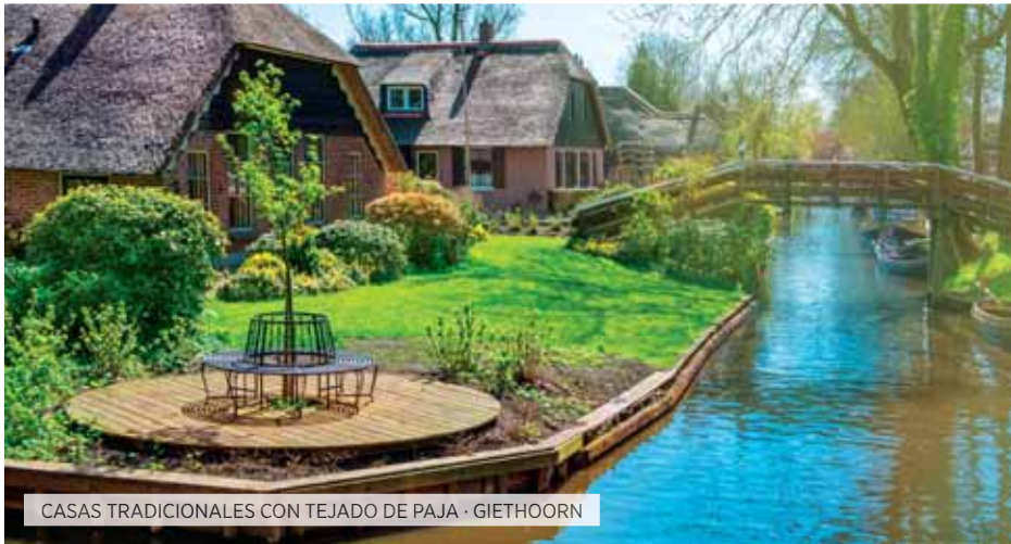
CASAS TRADICIONALES CON TEJADO DE PAJA - GIETHOORN