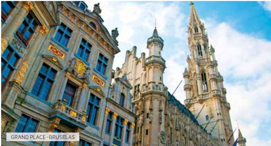
GRAND PLACE · BRUSELAS