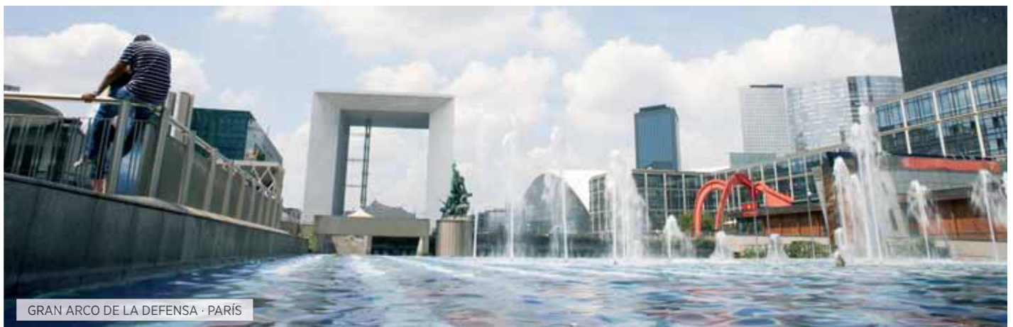
GRAN ARCO DE LA DEFENSA · PARÍS