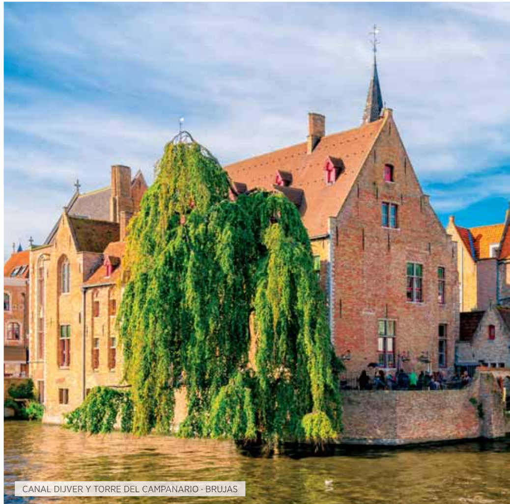
CANAL DIJVER Y TORRE DEL CAMPANARIO · BRUJAS

Desayuno. Visita panorámica de los edificios y monumentos más importantes de la capital francesa: conocerlas Plazas de la Concordia y de la Opera, los Campos Elíseos, el Arco de Triunfo, Barrios Latino y de St-Germain, Bulevares, etc. En la tarde visita opcional al Palacio de Versalles y sus jardines, que aunque comenzado por Luis XIII, quien quiso crear un palacio sin igual fue Luis XIV, el cual embelleció y amplió del edificio primitivo, mandando construir, entre otras salas, la Galería de los Espejos, sin duda la sala más impresionante, y que sirvió como escenario para la firma del Tratado de Versalles. Destacan así mismo la capilla, los salones de la Paz y de la Guerra, etc. Fue símbolo de la monarquía francesa en su esplendor y el modelo