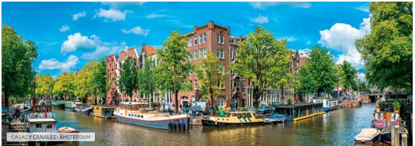
CASAS Y CANALES - ÁMSTERDAM