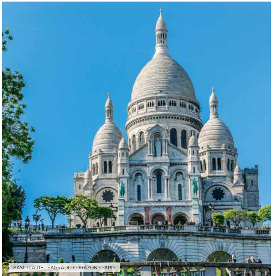
BAÑILICA DEL SAGRADO CORAZÓN · PARÍS

Desayuno. Salida hacia el Valle de Loira, una región de gran valor cultural y paisajístico, al tratarse del mayor espacio natural de Francia declarado Patrimonio Mundial de la UNESCO. Destacan sus castillos construidos en los s.