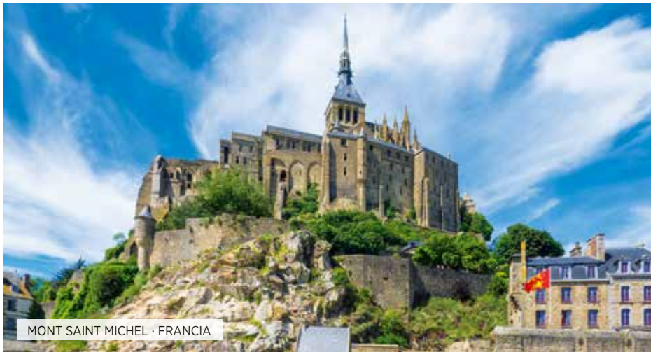
MONT SAINT MICHEL · FRANCIA