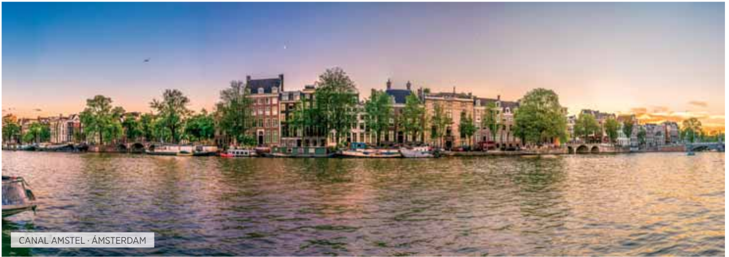
CANAL AMSTEL · ÁMSTERDAM