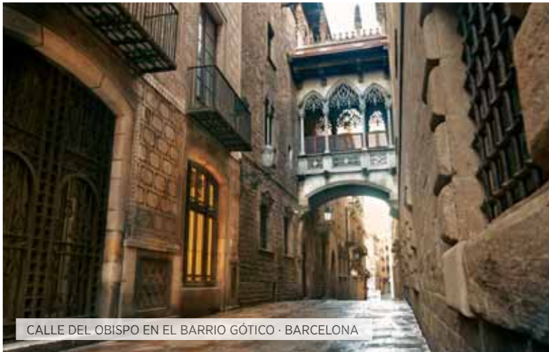
CALLE DEL OBISPO EN EL BARRIO GÓTICO · BARCELONA