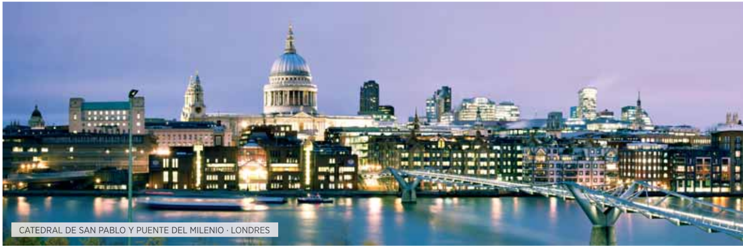
CATEDRAL DE SAN PABLO Y PUENTE DEL MILENIO · LONDRES