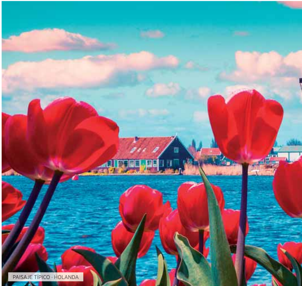
PAISAJE TÍPICO · HOLANDA

Salida de la ciudad de origen en avión hacia Europa.