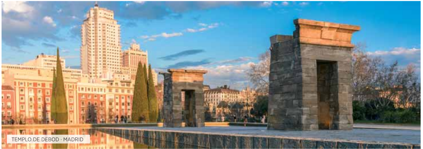
TEMPLO DE DEBOD · MADRID